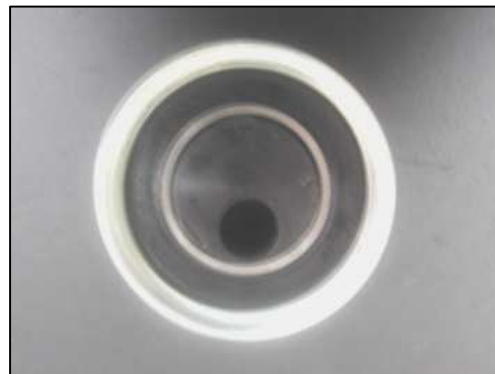
SKF gyártmány (RENAULT 77 00 736 085-vel megegyezik)